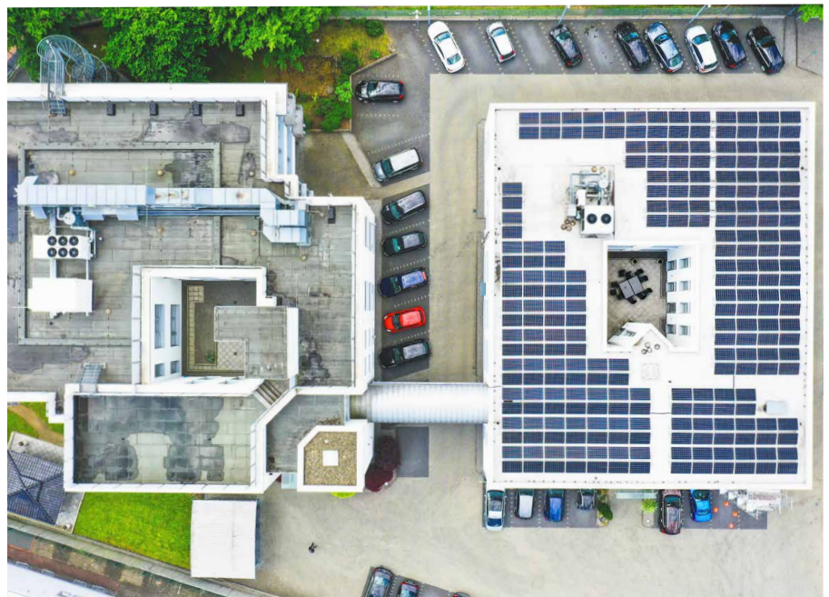
Die Firmenzentrale in Erlensee aus 50 Meter Höhe

Die neue Solaranlage auf dem Dach der Zentrale ist nicht nur ein zuverlässiger Stromerzeuger, der fast 35% der benötigten Energie für die Hauptverwaltung produziert, sie hat auch nach etwa zwei Jahren die Energie produziert, die für ihre Herstellung notwendig war. Die lange Lebensdauer von bis zu 25 Jahren sorgt zusätzlich für eine gute Ökobilanz. Zudem erzeugen Solaranlagen während des Betriebs keine Treibhausgase, wie beispielsweise Kohlekraftwerke und tragen somit nicht zur Erderwärmung bei.