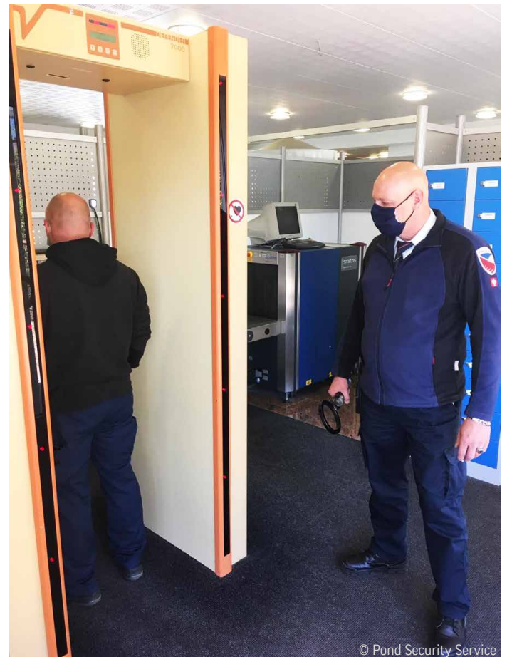
Mitarbeiter am Standort Grohnde

Trotz veränderter Arbeitsbedingungen, wie zum Beispiel das Tragen eines Mund-Nasen-Schutzes, konnte das Pond Security Team in Grohnde auch diese Anforderungen vorbildlich meistern. Durch die hohe Einsatzbereitschaft unserer Mitarbeiter konnte der Kunde die Revision der kerntechnischen Anlage ohne besondere Vorkommnisse durchführen.